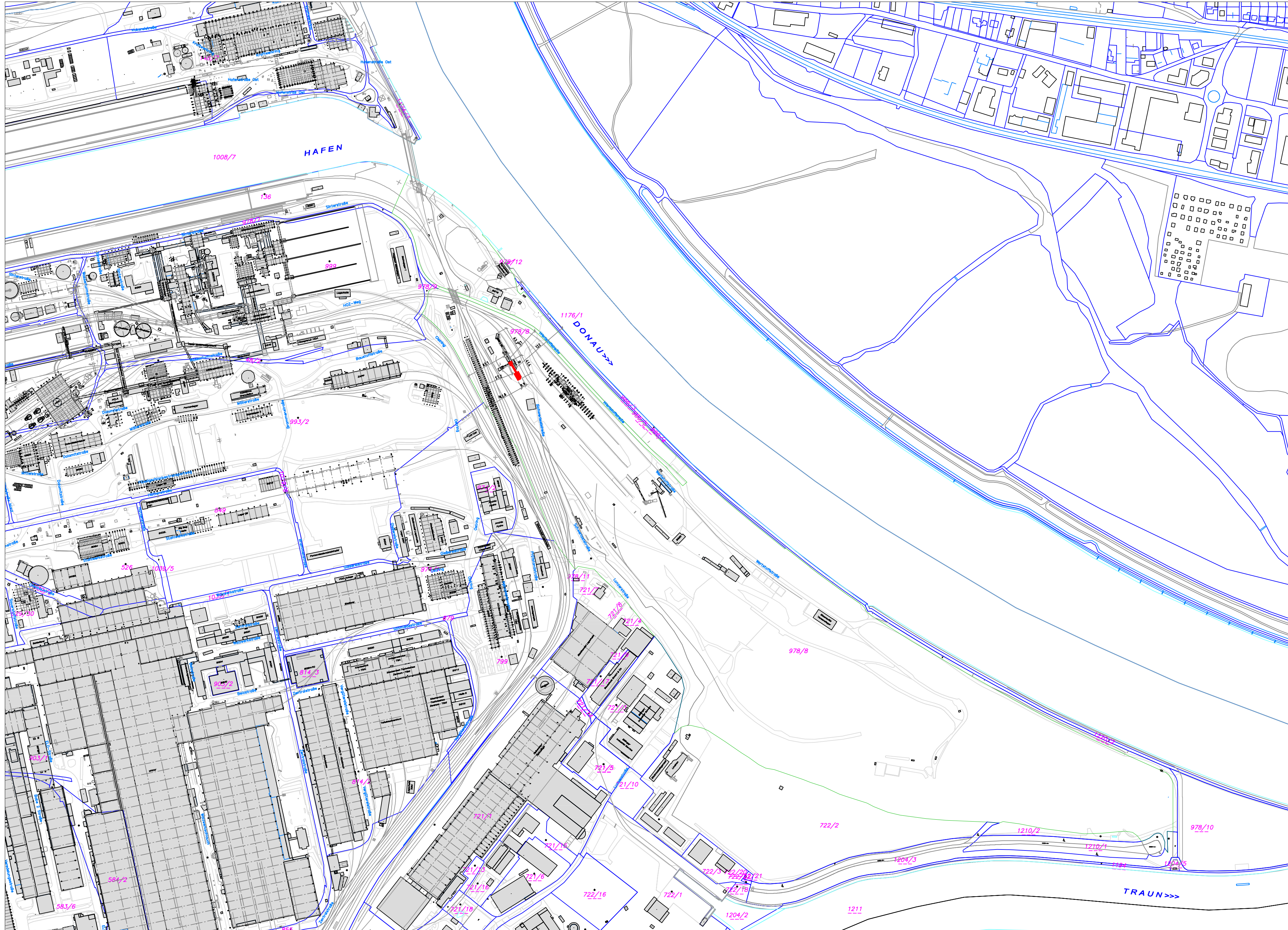
Übersichtsplan M 1 : 5000